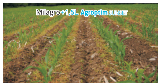
Stejné pole, aplikace ve stejný den, foceno 7 dní po aplikaci